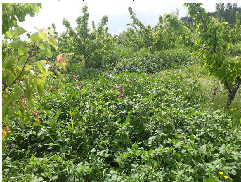
Inerbimento del frutteto con Sulla (leguminosa)