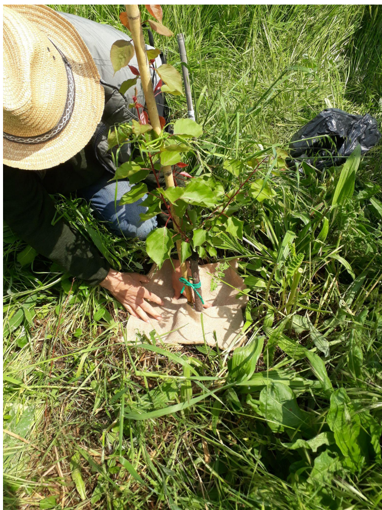
Una giovane pianta di albicocche (micorrizzate) con protezione contro il Capnodio con tessuto di juta