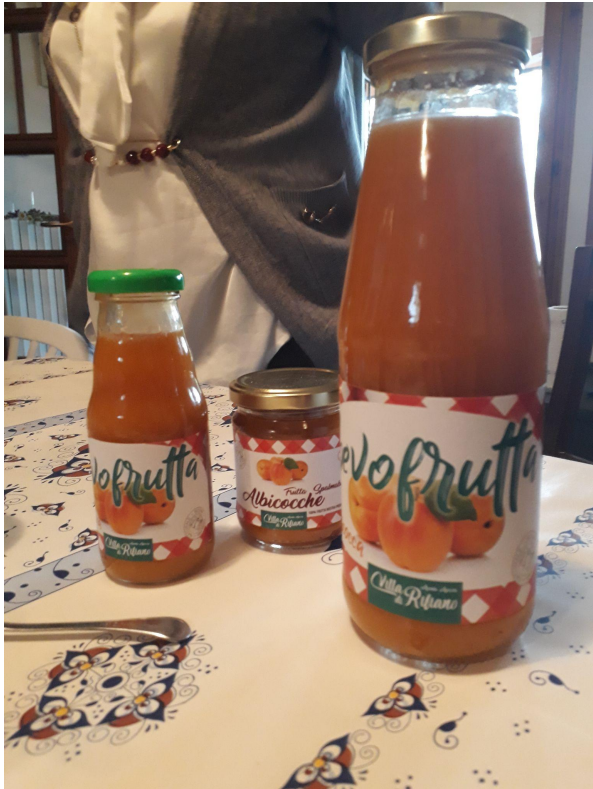
I trasformati : succo e marmellata di albicocche