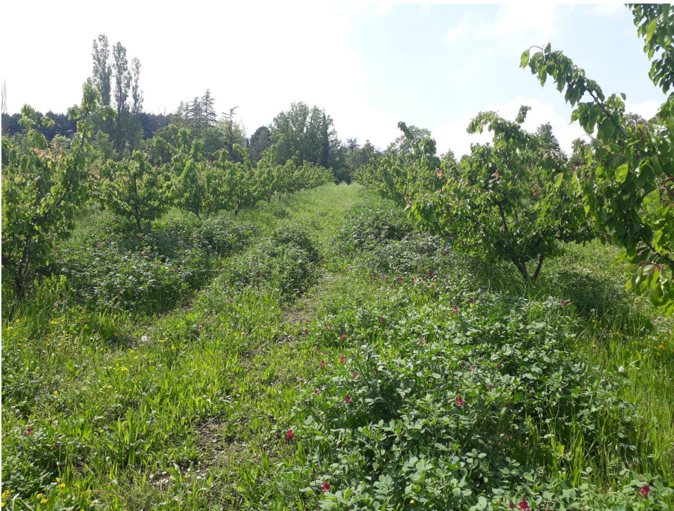
Il frutteto principale, sulla foto varietà Primidi