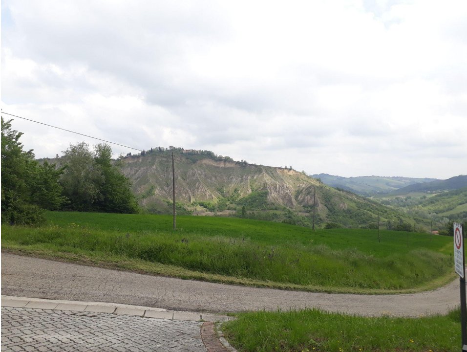
Il paesaggio intorno all'azienda: Colli in alta Valsellustra in comune di casalfiumanese