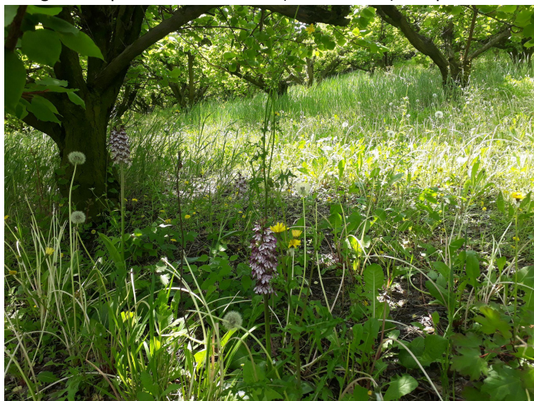
Presenza di Orchis e altre piante selvatiche nel frutteto